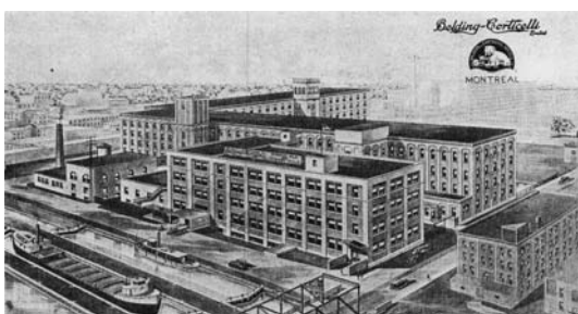
Belding-Corticelli Company, 1930 Manuel of the textile industry of Canada