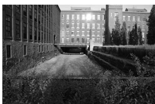
Canal de fuite, 2012