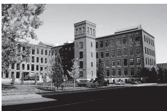
Loft Corticelli, 2012