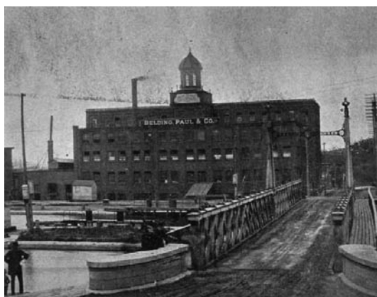
Belding Paul & Company, 1891

Emplacement géographique stratégique 1 ère usine de transformation de soie au Canada Vestiges uniques - canal de fuite