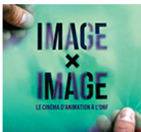
IMAGE X IMAGE LE CINÉMA D'ANIMATION À L'ONF 4 juin 2014 au 23 août 2014 | Musée de la civilisation, Québec