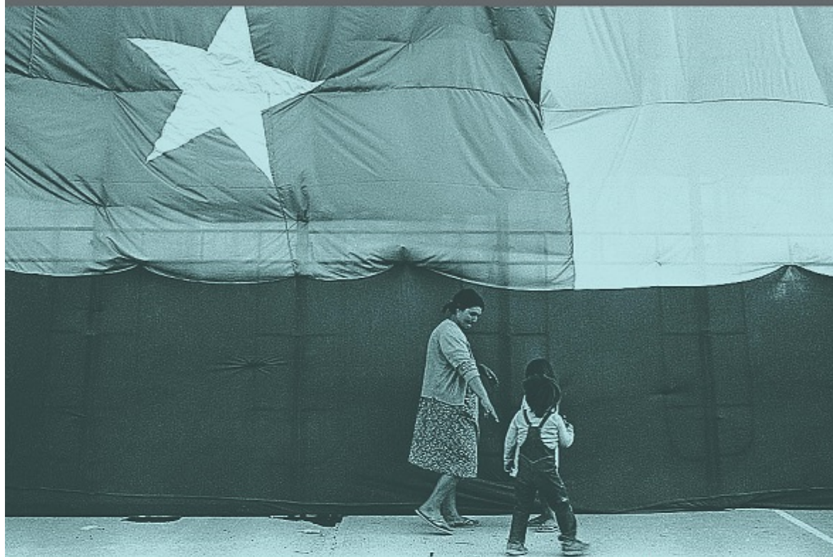
Parc O'Higgins, Santiago, Chili, 18 novembre 1982

VISITE À L'UQAM DE L'EXPOSITION ITINÉRANTE DU MUSÉE DE LA MÉMOIRE ET DES DROITS DE LA PERSONNE DU CHILI