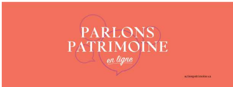
Table ronde | Parlons patrimoine en ligne