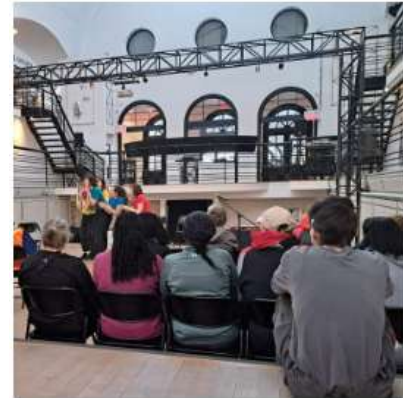
Prestation des Porteuses d'Échos, 2026. Écomusée du fier monde.

Vous souhaitez participer à une visite au musée qui sort de l'ordinaire ? Joignez-vous à nous pour une expérience unique et immersive en compagnie des Porteuses d'Échos. [...]